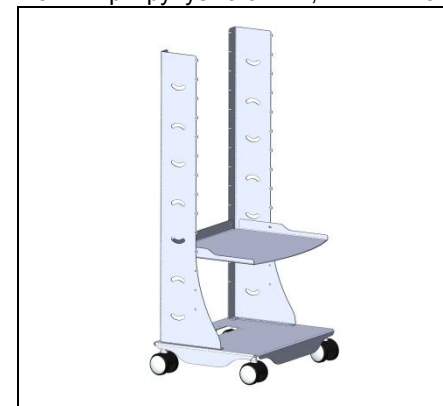
Мал.4 Кріпимо полиці гвинтом М4.