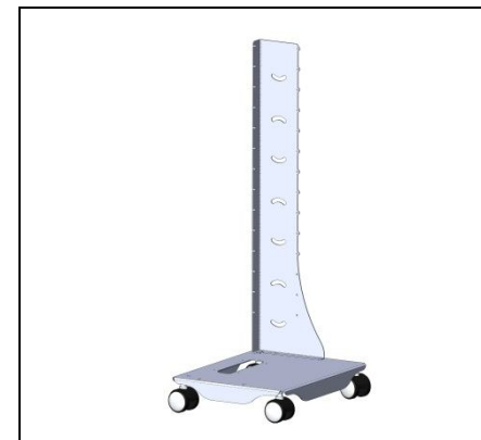
Мал.2 Прикручуємо стійки, гвинти М5.