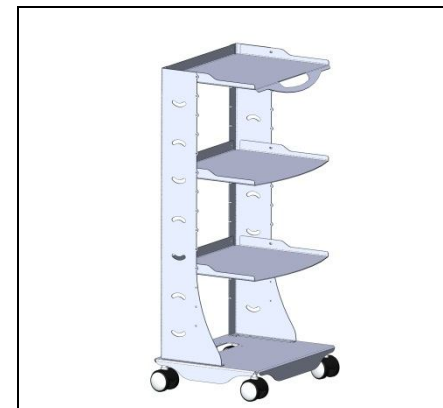
Мал.6 Під гайку ставимо шайбу.

Після того як стіл було зібрано, затягуємо з зусиллям всі кріплення.